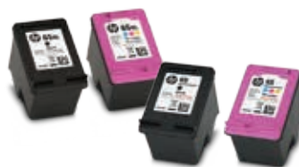
Cartouches d'encre HP d'origine

1 Les opérations sans fil ne sont compatibles qu'avec un fonctionnement à 2,4 et 5,0 GHz. Pour en savoir plus, consultez hp.com/go/mobileprinting . Wi-Fi® est une marque de commerce déposée de Wi-Fi Alliance®.