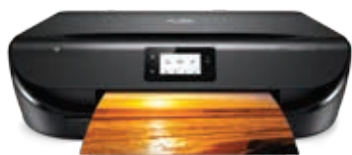
HP ENVY 5055 Tout-en-un HP 65 et 65XL

Si vous n'avez pas accès à Internet, contactez votre revendeur agréé HP.