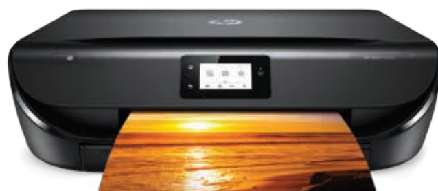
HP ENVY 5055 Tout-en-un