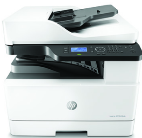
Stampante multifunzione HP LaserJet M436nda

Aumentate le vostre possibilità di lavoro con questa stampante multifunzione A3 efficiente, affidabile e dal costo contenuto. Flussi di lavoro semplificati grazie a soluzioni di copia e scansione efficienti con connettività di rete e monitoraggio da remoto. 1 Risparmio di tempo e risorse con funzionalità di gestione automatica della carta. 2,3