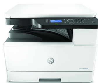
Stampante multifunzione HP LaserJet M436n