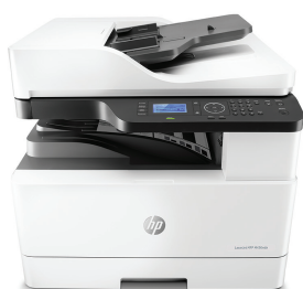
Multifunkčné zariadenie HP LaserJet M436nda

Rozšírte svoj potenciál so spoľahlivým a cenovo dostupným multifunkčným zariadením A3 Zjednodušte pracovné procesy s riešeniami na efektívne skenovanie a kopírovanie a získajte sieťové funkcie so vzdialeným monitorovaním. 1 Šetrite zdroje a čas s automatickými funkciami manipulácie s papierom. 2,3