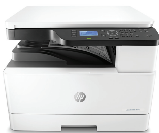
Multifunkčné zariadenie HP LaserJet M436n