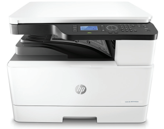
HP LaserJet MFP M436n