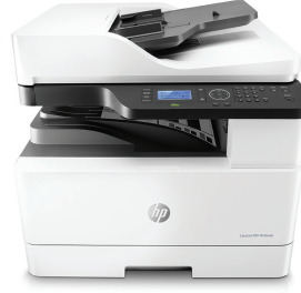
HP LaserJet MFP M436nda

Potansiyelinizi artırmak için güvenilir, uygun fiyatlı A3 MFP'ye güvenebilirsiniz. Verimli tarama çözümleri ve kopyalama ile iş akışlarını kolaylaştırın ve ağ kullanımının yanı sıra uzaktan izlemeyi kullanın. 1 Otomatik kağıt işleme özellikleri ile kaynak ve zamandan tasarruf edin. 2,3