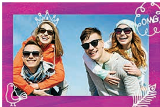
Impression à partir de HP Sprocket Plus 2

Avec la connectivité Bluetooth®, vous et vos amis pouvez facilement vous connecter pour imprimer. Consultez la gamme d'accessoires Sprocket disponibles sur hp.com/go/sprocketgetstarted . 4