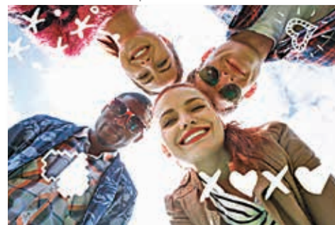
Impressions à partir de HP Sprocket 2 en 1 2