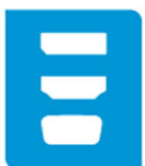
Displayport, HDMI, VGA