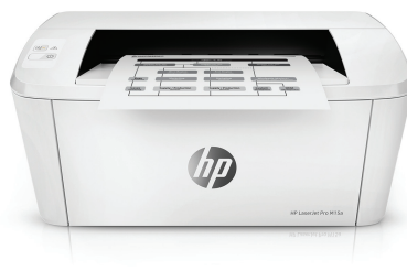
HP LaserJet Pro M15a -tulostin

Nopeaa tulostusta laitteella, joka mahtuu tilaasi ja budjettiisi. Tulosta ammattimaisen laadukkaita tulosteita sekä tulosta ja skannaa älypuhelimellasi. 2,3