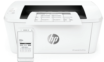
HP LaserJet Pro M15w -tulostin