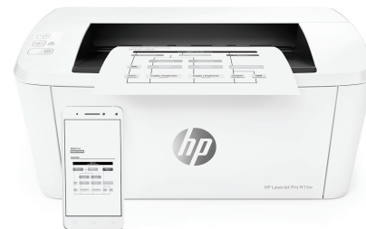
Imprimante HP LaserJet Pro M15w