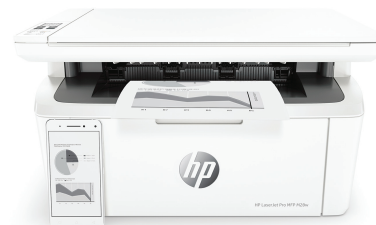
Imprimante multifonction HP LaserJet Pro M28w