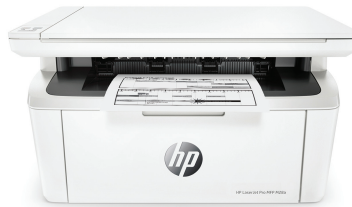
HP LaserJet Pro M28a MFP nyomtató

Használja ki az MFP készülék előnyeit, amely igazodik a rendelkezésre álló helyhez és anyagi keretekhez. A nyomtatási, beolvasási és másolási műveletek professzionális minőséget garantálnak. Egyszerűen indíthat nyomtatást és beolvasást az okostelefonjáról. 2,3