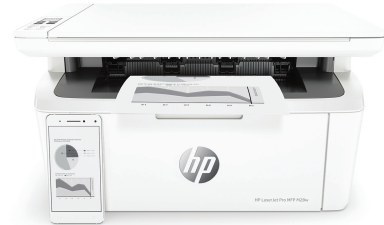
HP LaserJet Pro M28w MFP nyomtató