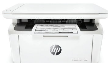
Imprimantă HP LaserJet Pro MFP M28a

Obține performanța productivă a echipamentului MFP potrivit pentru spațiul și bugetul tău. Imprimarea, scanarea și copierea produc rezultate de calitate profesională. Imprimă și scanează simplu de pe smartphone. 2,3