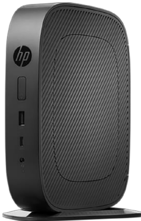
Тонкий клиент HP t530

Подготовьте офис к грядущим вызовам: благодаря системе хранения на основе флеш-накопителей, большому объему памяти, различным интерфейсам и широкому набору разъемов (в том числе USB-C™ для подключения новых и устаревших периферийных устройств) вы легко сможете шагнуть в будущее.