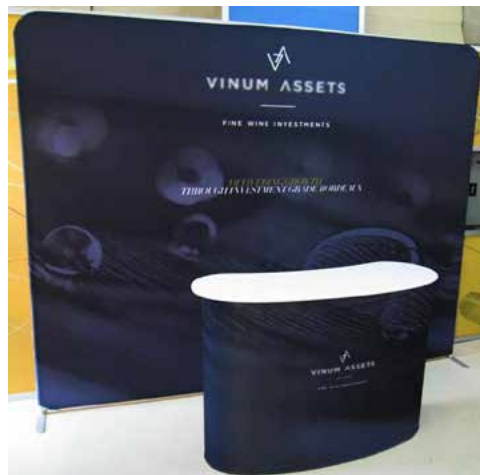
Obrázek 2: Příklad poutače z napínané tkaniny

Další výhodou je, že procesy, které jsou součástí výroby měkkých poutačů, se výrazně neliší od tradičnějších tiskových procesů, takže před výrobou těchto aplikací není třeba náročné zaučování.