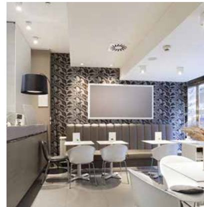
Dekorace v místní restauraci