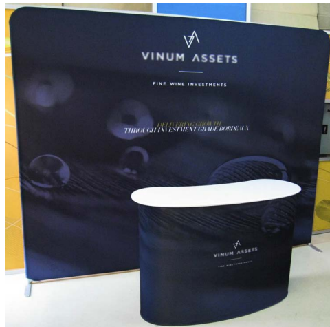
Abbildung 2: Beispiel eines gespannten Stoffdisplays

Auch wenn in der Vergangenheit klassischerweise Vinyl, Plastik und Papier für Signage-Zwecke zum Einsatz kamen, werden Textilien und Stoffe immer beliebter. Soft Signage bietet eine Reihe von Vorteilen, z. B. besonders brillante Farben, auffällige Effekte, attraktive Optionen für die Hintergrundbeleuchtung, hohe Farb- und Materialstabilität, die Möglichkeit, Displays auf unregelmäßigen Oberflächen zu erstellen, und Drucke, die sich ohne Beschädigungsgefahr falten oder aufrollen lassen. Gespannte Stoffdisplays sind mittlerweile weit verbreitet, und Messebauer nutzen Textildruck begeistert zur Herstellung einzelner Exponate oder sogar für komplette Standkonstruktionen.