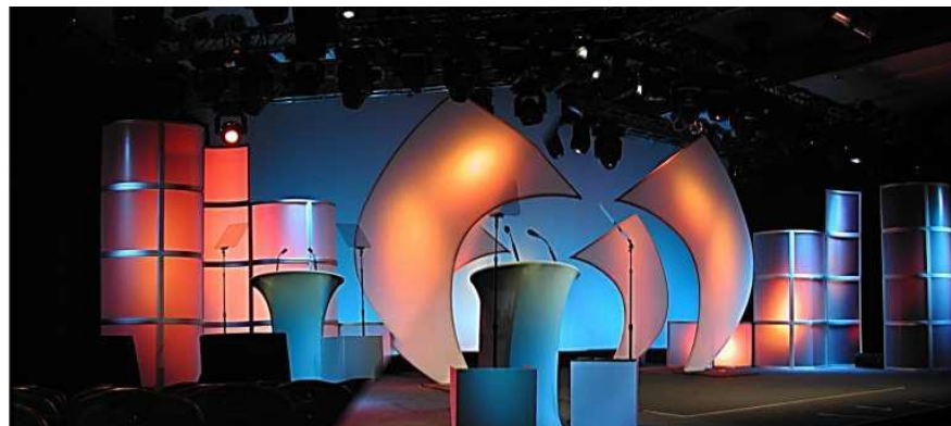
Abbildung 2: Beispiel eines gespannten Stoffdisplays

Auch wenn in der Vergangenheit klassischerweise Vinyl, Plastik und Papier für Signage-Zwecke zum Einsatz kamen, werden Textilien und Stoffe immer beliebter. Soft Signage bietet eine Reihe von Vorteilen, z. B. besonders brillante Farben, auffällige Effekte, attraktive Optionen für die Hintergrundbeleuchtung, hohe Farb- und Materialstabilität, die Möglichkeit, Displays auf unregelmäßigen Oberflächen zu erstellen, und Drucke, die sich ohne Beschädigungsgefahr falten oder aufrollen lassen. Gespannte Stoffdisplays sind mittlerweile weit verbreitet, und Messebauer nutzen Textildruck begeistert zur Herstellung einzelner Exponate oder sogar für komplette Standkonstruktionen.