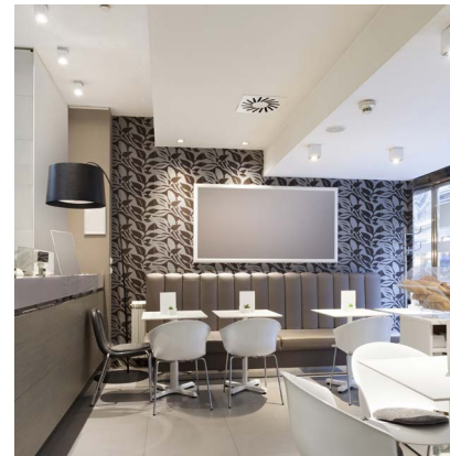
Dekorationen in einem lokalen Restaurant