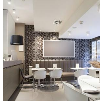
Lokantadaki dekoratif dokunuşlar