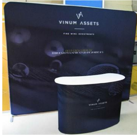
Figure 2: Example of a Tensioned Fabric Display

Her ne kadar folyo, plastik ve kağıt geçmişten günümüze kullanılagelen tabela malzemeleri olsa da, tekstil ve kumaş malzeme de giderek daha popüler hale gelmektedir. Tabela uygulamalarının sunduğu öncelikli avantajlar şunlardır; daha zengin renkler, daha fazla göz alıcı efekt, arkadan aydınlatma için çekici seçenekler, daha az kıvrılma/reng verme, eğri yüzeylere baskı yapma seçeneği ve zarar görmeden katlanma veya rulo haline gelme özelliği. Gerilebilen kumaş afişler oldukça yaygın hale gelmiştir, bu nedende fuar/sergi etkinliği düzenleyen şirketler tekstil üzerine baskı seçeneğini benimseyerek, tabela ve hatta fuar standı oluşturma işini verimli biçimde çözmüştür.