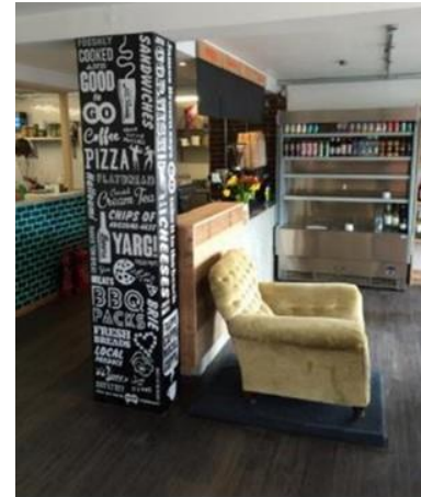
레스토랑 인테리어의 예시