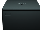
HP Engage One Serial/USB Thermal Printer

הגדר מחדש את תפיסת ההדפסה הקמעונית עם המדפסת התרמית בחיבור USB טורי HP Engage One, מדפסת קומפקטית המושכת את העין בסגנון קוביסטי שתוכננה להדפיס ביחד עם HP Engage One בנקודת המכירה. זמין גם בלבן - 3GS19AA הגדר מחדש את תפיסת ההדפסה הקמעונית עם המדפסת התרמית בחיבור USB טורי HP ElitePOS, מדפסת קומפקטית המושכת את העין בסגנון קוביסטי שתוכננה להדפיס לצד HP ElitePOS בנקודת המכירה. מק"ט: 1RL96AA