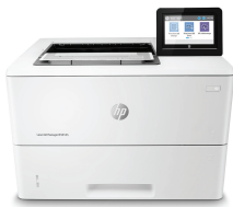
HP LaserJet E50145dn Managed

Imprimante avec sécurité dynamique activée. Uniquement destinée à être utilisée avec des cartouches dotées d'une puce authentique HP. Les cartouches dotées d'une puce non HP peuvent ne pas fonctionner et celles qui fonctionnent actuellement pourraient ne plus fonctionner à l'avenir. http://www.hp.com/go/learnaboutsupplies