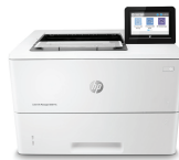
HP LaserJet E50145dn Managed