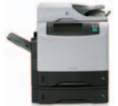
HP LaserJet 4345x mfp