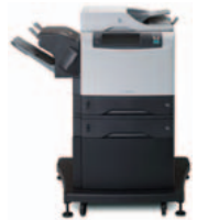
HP LaserJet 4345xs mfp