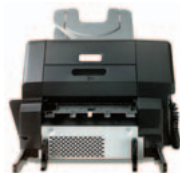
(Q5692A) 700 arkin 3-lokeroinen mailbox-lajittelulaite – määritys yksittäis- käyttäjille tai laitetoiminnoille