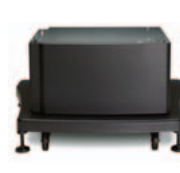
(Q5970A) Teline ja aluskaappi – kätevää säilytystä, helpommin käytettävissä