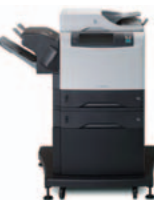
HP LaserJet 4345xs mfp