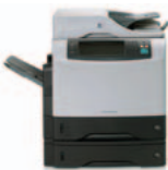
HP LaserJet 4345x mfp