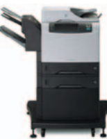
HP LaserJet 4345xm mfp