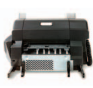
(Q5691A) Nitoja/niputtaja – nitoo jopa 30 sivua; niputtaa jopa 500 arkkiä