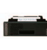
(Q5969A) Automaattinen kaksi- puolinen tulostusyksikkö – nopeaa, tehokasta kaksipuolista tulostusta