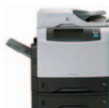
HP LaserJet 4345x mfp