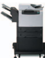
HP LaserJet 4345xm mfp