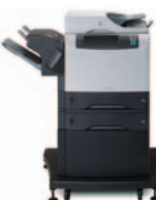
HP LaserJet 4345xs mfp