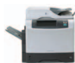
HP LaserJet 4345mfp