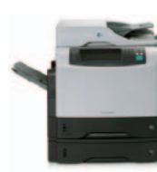
(Q3943A) 4345x mfp