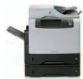
HP LaserJet 4345x mfp