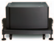
(Q5970A) מעמד עם תא אחסון – אחסון נוח וגישה קלה