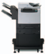
(Q3945A) 4345xm mfp