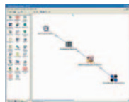
(T1943AA) תוכנת אחסון אוטומטי HP AutoStore – שלח עבודות מודפסות שנרקו, לישומי ניהול מסמכים