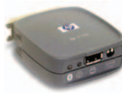
(J6072A) מתאם מדפסת אלחוטי HP bt 1300 Bluetooth ®10 – הדפס מטלפונים ניידים או מיומנים אלקטרוניים (PDA)