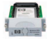
(J6058A) שרת הדפסה אלחוטי HP Jetdirect 680n 802.11b – לקשר אלחוטי