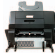
(Q5692A) תיבת דואר בעלת 3 סלים ל-700 גיליונות – הקצה לאנשים או לתפקודי ההתקן