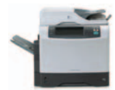
HP LaserJet 4345mfp