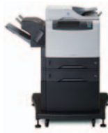
(Q3944A) 4345xs mfp