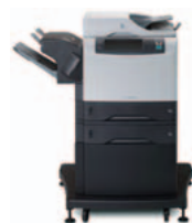
HP LaserJet 4345xs mfp