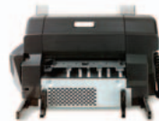
(Q5691A) מהדק/מערום – הדק עד 30 דפים; ערום עד 500 גיליונות