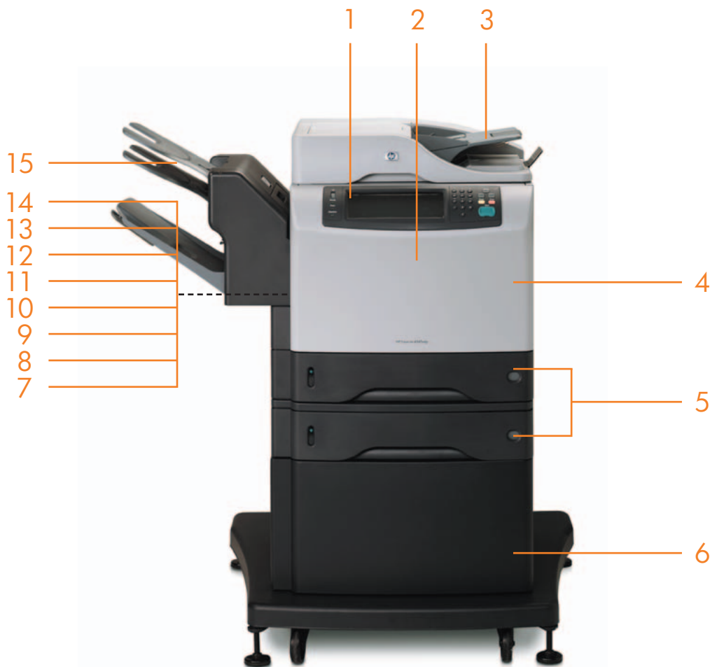
Az ábrán a HP LaserJet 4345xm mfp látható