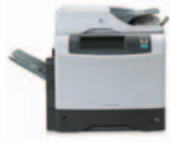
HP LaserJet 4345mfp