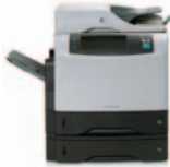
HP LaserJet 4345x mfp