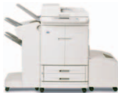
HP Color LaserJet 9500mfp s odkládacím zásobníkem

Q5693A – Třídička s 8 zásobníky Každý zásobník třídičky může být ke snadnému odebrání dokumentů vyhrazen pro jednotlivce, pracovní skupiny nebo oddělení. Třídička může být také konfigurována jako třídička/odkládací zásobník, odkládací zásobník a separátor úloh.