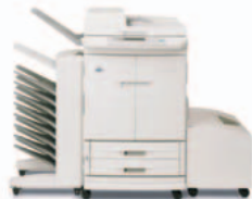
HP Color LaserJet 9500mfp s třídičkou s 8 přihrádkami

Napájecí kabel, telefonní kabel (pouze v zemích, ve kterých je zajištěna podpora faxu), dokumentace k tiskárně, software tiskárny na disku CD-ROM, přelepka ovládacího panelu, tiskové kazety (4), dva vstupní zásobníky na 500 listů, víceúčelový zásobník na 100 listů, velkokapacitní vstupní zásobník na 2 000 listů (Q1891A), automatický oboustranný tisk, automatický podavač dokumentů, tiskový server HP Jetdirect 620n Fast Ethernet, pevný disk 20 GB EIO – nezbytné zařízení k výstupu papíru je třeba vybrat a objednat samostatně.