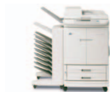
HP Color LaserJet 9500mfp med valgfri 8-rums mailbox