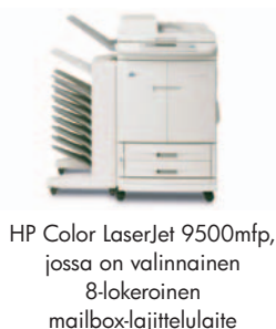
HP Color LaserJet 9500mfp, jossa on valinnainen 8-lokeroinen mailbox-lajittelulaite