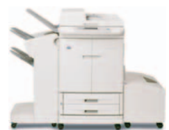
HP Color LaserJet 9500mfp, jossa on niputtaja/nitoja ja valinnaisesti erikoistilava paperialusta