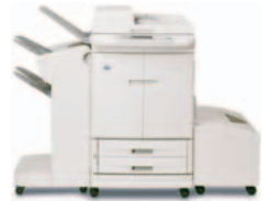
HP Color LaserJet 9500mfp, jossa nitotaja/niputtaja

Mahdollistaa 1 000 arkin niputuksen, jopa 50 paperiarkin nidonnan työtä kohti, taittaa arkkit vihkotyypiksi sarjoiksi sekä taittaa ja nitoo kirjasia, joissa on jopa 10 paperiarkkia.