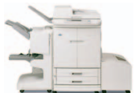
HP Color LaserJet 9500mfp, met multifunctionele finisher en optionele high-capacity invoerlade