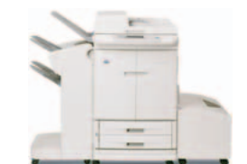
HP Color LaserJet 9500mfp, met uitvoereenheid/nietmachine en optionele high-capacity invoerlade