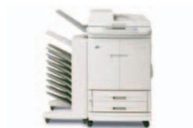
HP Color LaserJet 9500mfp met optioneel 8-baks sorteersysteem