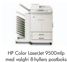
HP Color LaserJet 9500mfp med valgfri 8-hyllers postboks