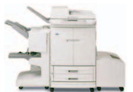
HP Color LaserJet 9500mfp, med flerfunksjons ferdigstiller og ekstra høykapasitetsmagasin