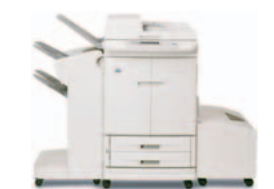
HP Color LaserJet 9500mfp, med stifte-/stabling og ekstra høykapasitetsmagasin