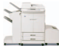
HP Color LaserJet 9500mfp (a cores) com agrafador/empilhador

Proporciona capacidade de empilhamento para até 1 000 folhas, de agrafamento para até 50 folhas de papel por trabalho, de dobragem de folhas em conjuntos do estilo de brochuras, para além da produção de folhetos brochados com grafos de até 10 folhas de papel.