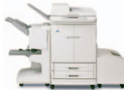
HP Color LaserJet 9500mfp (a cores), com sistema de acabamento multifunções

Empilha até 3 000 folhas de papel com separação de trabalhos em espinha.