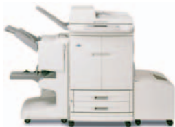
HP Color LaserJet 9500mfp, com sistema de acabamento multifunções e tabuleiro de entrada de alta capacidade opcional