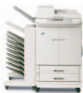
HP Color LaserJet 9500mfp (a cores) com caixa de correio com 8 tabuleiros opcional