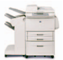
HP LaserJet 9040mfp/9050mfp