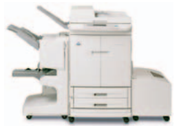
HP Color LaserJet 9500mfp