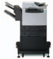
أجهزة HP LaserJet 4345mfp