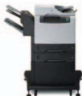
HP LaserJet 4345 mfp serien