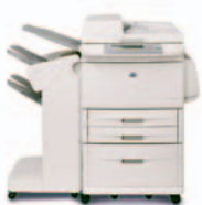
HP LaserJet 9040mfp/9050mfp