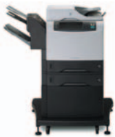
HP LaserJet 4345mfp serie