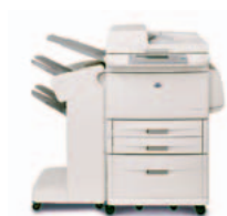
HP LaserJet 9040mfp/9050mfp