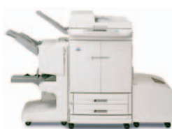
HP Color LaserJet 9500mfp