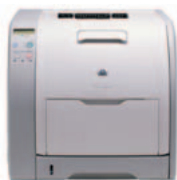
Tiskárna řady HP Color LaserJet 3550/n

Zaved'te barvy do svého podniku a získejte náskok před konkurencí s těmito cenově dostupnými, rychlými a profesionálními tiskárnami HP Color LaserJet.