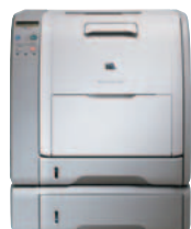
Tiskárna HP Color LaserJet 3700/n/dn/dtn Na obrázku je tiskárna HP Color LaserJet 3700dtn

Tiskárny řady HP Color LaserJet 3550 a 3700 představují vynikající volbu pro malé a střední podniky a jsou ideální k síťovému sdílení pro pracovní skupiny o 2 až 15 uživatelích. Za atraktivní cenu poskytují vynikající kvalitu tisku, snadnost použití, rychlost a spolehlivost, jakou od produktů HP očekáváte při tvorbě nejrůznějších barevných dokumentů.