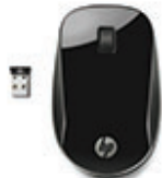
Rato sem fios preto HP Z4000 H5N61AA