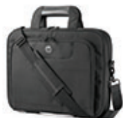
HP Value Top Load-väska - 40,9 cm (16,1 tum) QB681AA