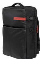
Sac à dos HP 17.3 Omen K5Q03AA