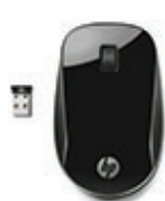
HP Z4000 Schwarze drahtlose Maus H5N61AA