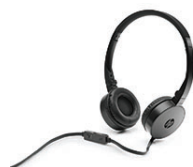
HP H2800 Headset, schwarz J8F10AA