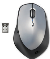
HP:n langaton hiiri X5500 H2W15AA