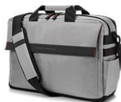
Custodia con apertura in alto HP Trend da 39,62 cm (15,6") L6V62AA