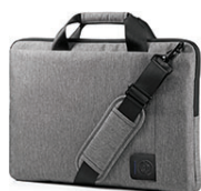
Τσάντα HP 39,6 cm (15,6 ιν.) G8Y15AA