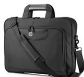
Custodia con apertura in alto - 45.7 cm (18") HP Value QB683AA