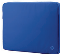
HP:n 29,46 cm:n (11,6 tuuman) Spectrum-suojus, sininen M5Q17AA