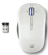
HP X3300 (White) Wireless Mouse H4N94AA