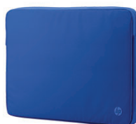
Housse de protection Spectrum HP 29,46 cm (11,6 pouces) (bleu) M5Q17AA