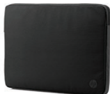
Zwarte hoes voor HP 29,46-cm (11,6-inch) Spectrum M5Q10AA