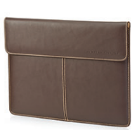
HP 13,3 Deri Kılıf F3W21AA